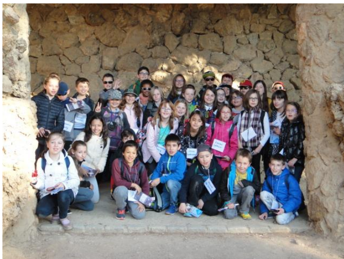
Los alumnos de CM